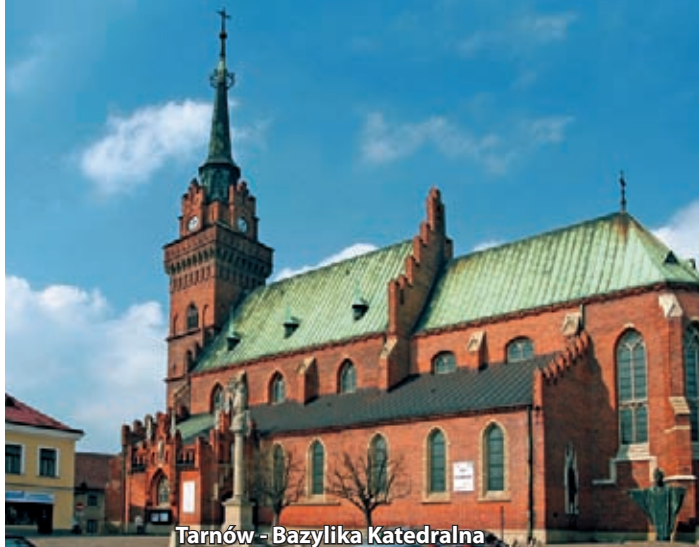
Tarnów - Bazylika Katedralna