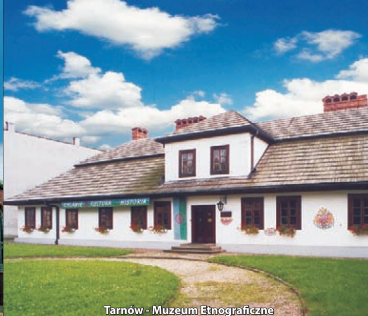
Tarnów - Muzeum Etnograficzne