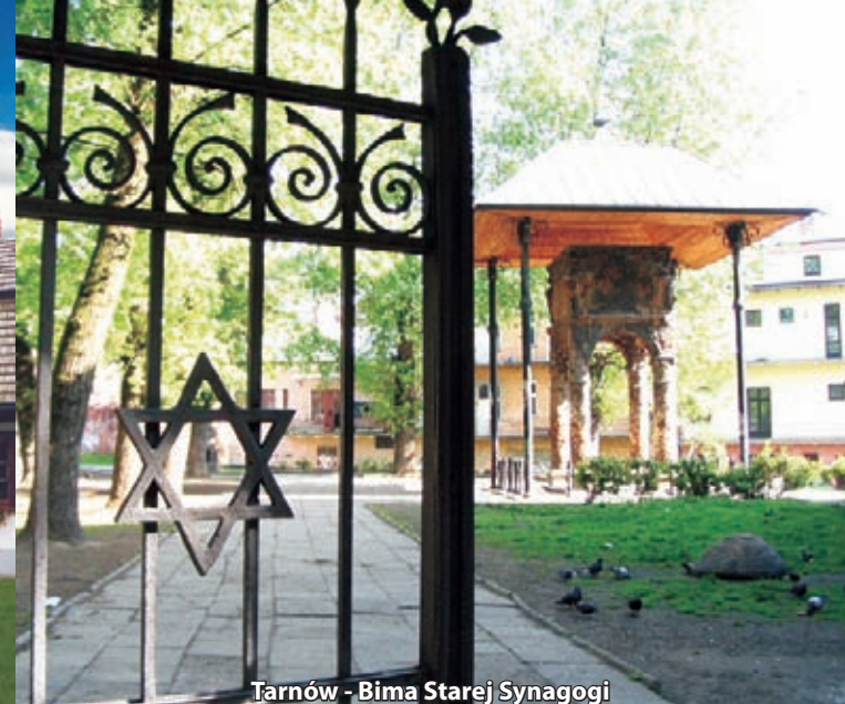
Tarnów - Bima Starej Synagogi

Tarnowska starówka , zwana "perłą polskiego renesansu", jest jednym z najpiękniejszych przykładów renesansowego układu architektonicznego polskich miast.